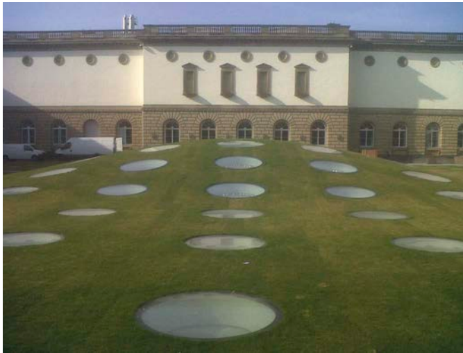
Bild 2 Stadel Museum Frankfurt/M.: Hochwertig genutzte Untergeschosse