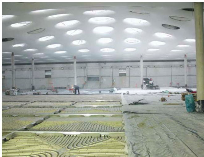
Bild 4 Hochwertiger Bodenaufbau mit Fußbodenheizung bei der Erweiterung des Städel Museums in Frankfurt/M.

An nicht zugängigen Bereichen können geeignete Abdichtungs-systeme somit vorsorglich und „planmäßig“ vorgesehen werden.