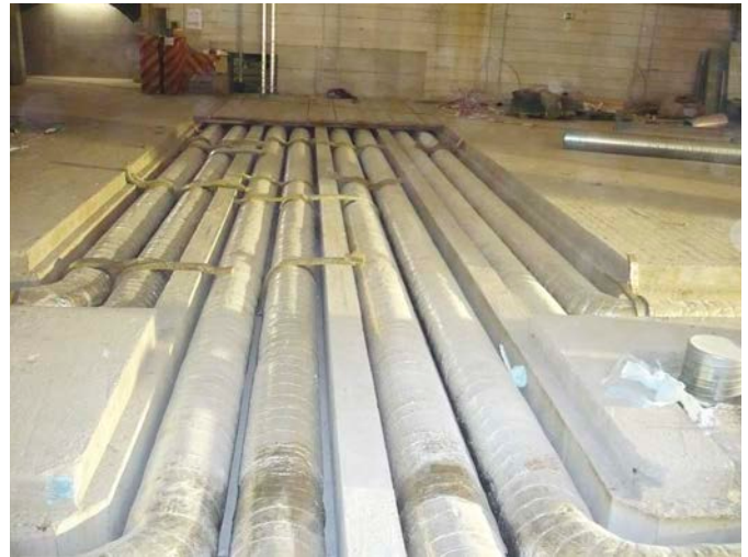
Bild 3 Erweiterung des Stadel Museums in Frankfurt/M.: technische Anlage in der Bodenplatte integriert

mit den vorgegebenen Rahmenbedingungen, sind vielen Tragwerksplanern nicht bekannt.