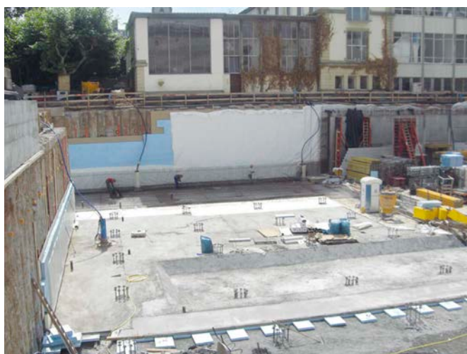
Bild 5 WU-Konstruktion mit Dämmung und adicon® AVS (Abdichtungsverbandfolie) unter der Bodenplatte und gegen Verbauwand; Voutenausbildung und Zuggpfähle als Zwangsbehinderung der Bodenplatte

Hierzu eignen sich neuerdings die sogenannten Abdichtungsverbandsysteme AVS (Titelbild und Bild 5).