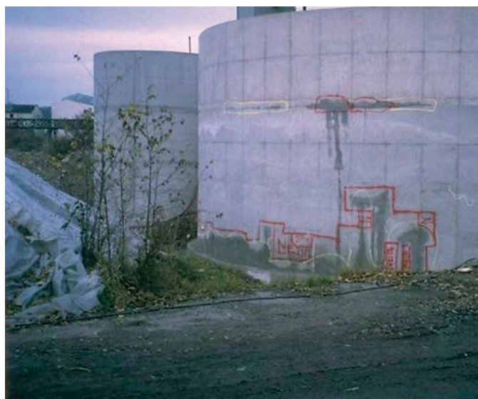
Bild 1 Klassische „Weiße Wanne“ nach [1] und [3], Selbstheilungseffekt/Bild [1] bei Probefüllung der Behälter

Die Umsetzungen dieser charakteristischen Eigenschaften in Planung und Ausführung sind in der im November 2003 veröffentlichten WU-Richtlinie des Deutschen Ausschuss für Stahlbeton (DAfStb) und im zugehörigen Heft 555 [3] „Erläuterungen zur DAfStb Richtlinie – wasserundurchlässige Bauwerke aus Beton“ vom Februar 2006 beschrieben. Darüber hinaus gibt es